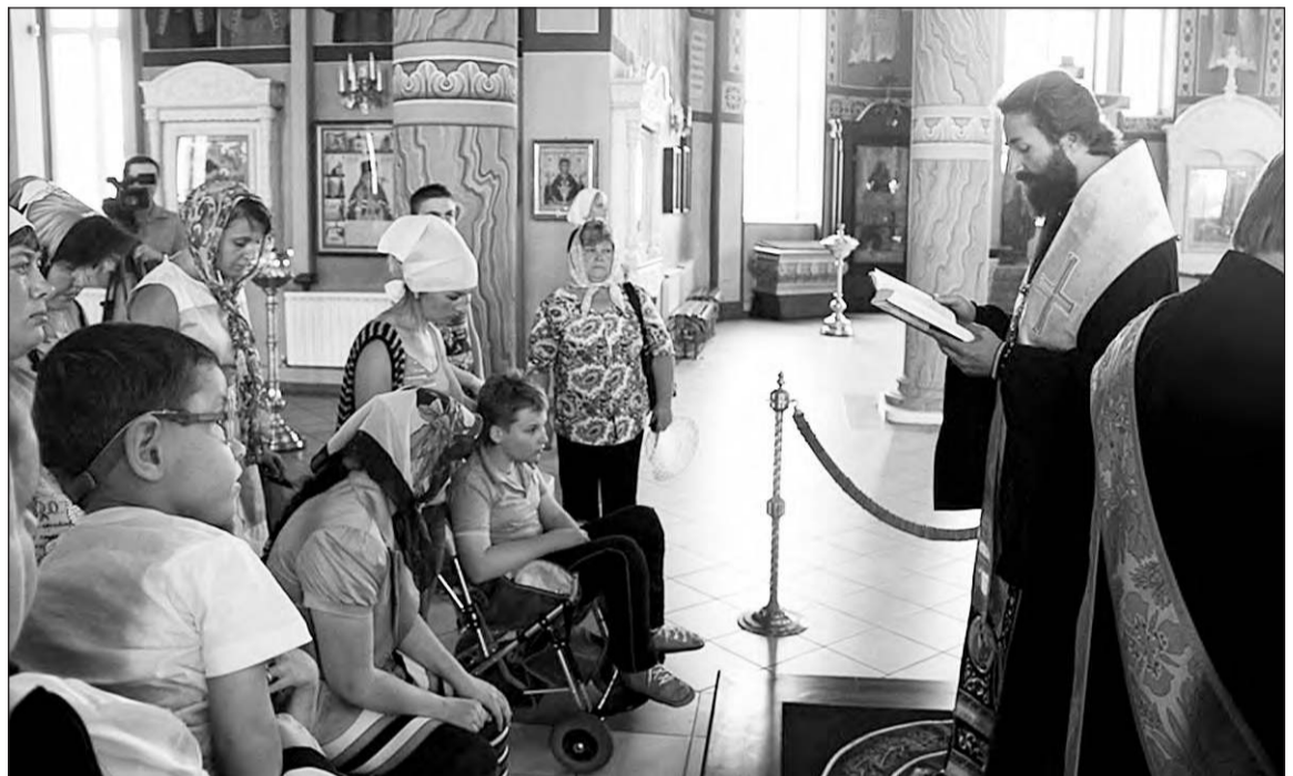
■ Помочь больным детям — богоугодное дело

Сейчас в Россошанской епархии идёт сбор средств на лечение девочки из Россошанского района, страдающей тяжёлым