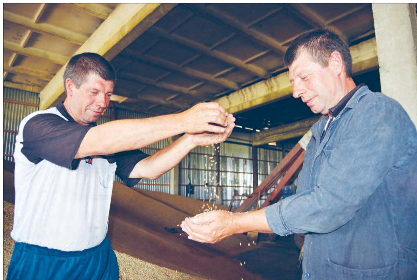
На такой урожай и глаз радуется

Братья Пушилины рады хорошему урожаю, но не скрывают и своей тревоги за судьбу сельскохозяйственного сектора