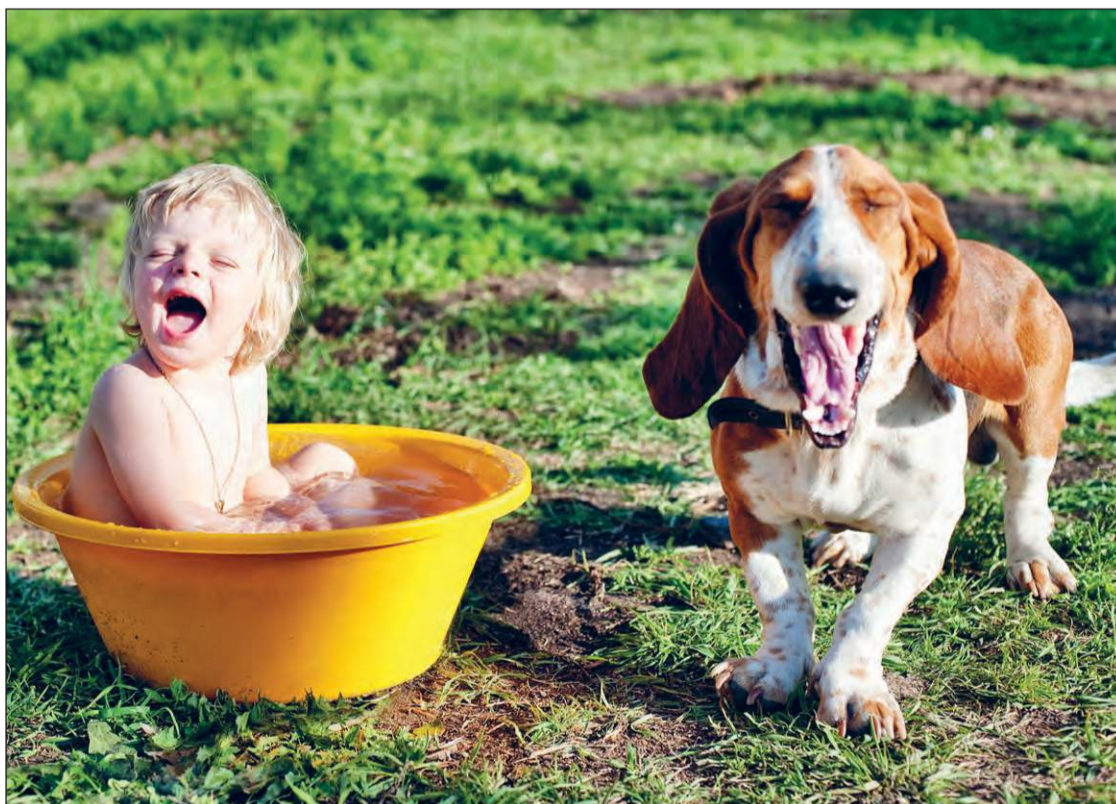
Фото Олега Когтева